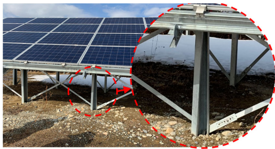
a) 支柱のねじれ挙動

近年、道東地域において凍上現状に起因すると思われる太陽光発電施設の被害（支柱のねじれ変形や、太陽光モジュールの反り）が相次いでいます（写真-1）。そこで、本公開実験では凍上量と部材応答の関係性を把握するため、支柱下端部に油圧ジャッキを設置し凍上を模擬した強制変位実験を実施します。