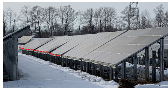
b) パネルの反り上がり