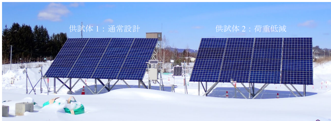
写真-2 実験対象構造

なお、本供試体を用い2023年10月から2024年3月の冬季期間において、長期的なひずみ計測および傾斜計測を行っています。暖冬ということもあり、凍上量は期待する半分の20mm程度に留まりましたが基本的な部材の応答を把握できました。