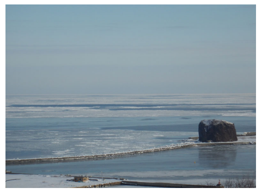
網走流水接岸初日